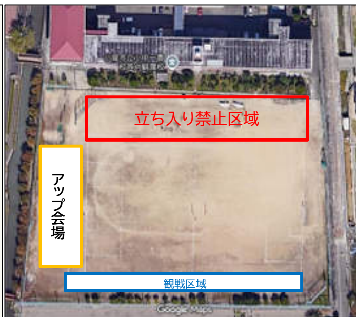
芦刈中学校 会場図