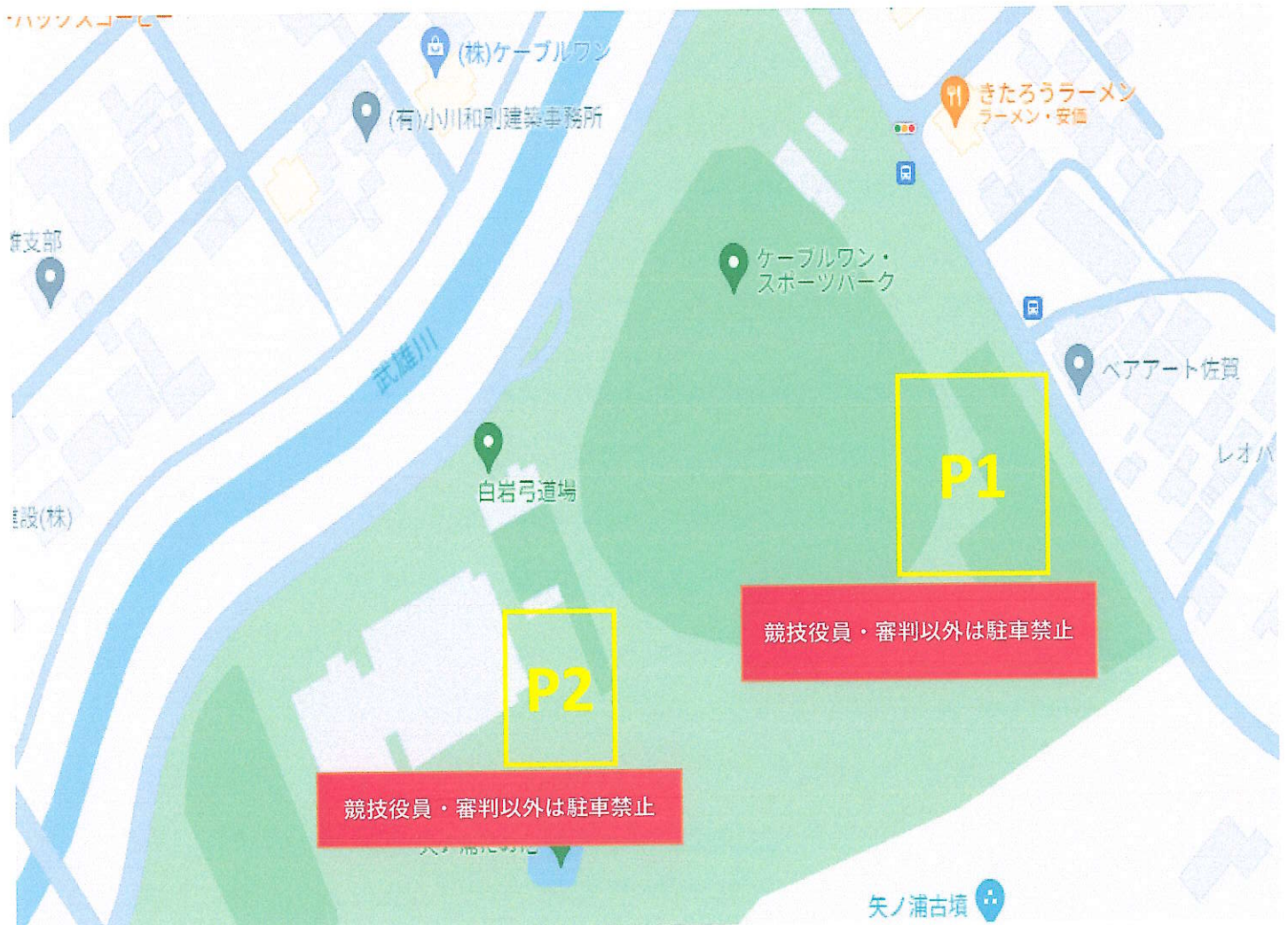
剣道(ケーブルワン)