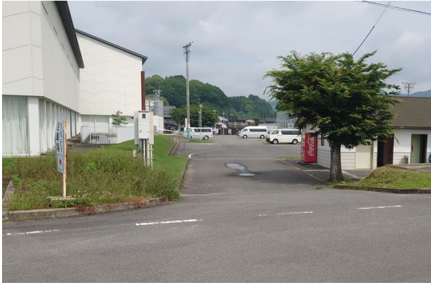
P 3 リバティ駐車場